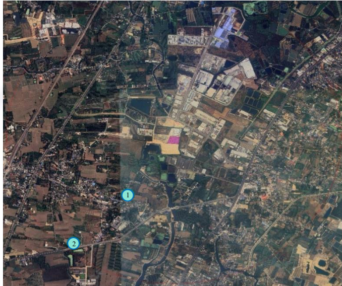
รูปที่ 4 ผังแสดงพื้นที่อ่อนไหวและหน่วยงานราชการ ในระยะ 1,000 เมตร จากขอบเขตพื้นที่โครงการ

ดำเนินการสำรวจสภาพเศรษฐกิจและสังคม บริเวณพื้นที่อ่อนไหวและหน่วยงานราชการ ในระยะ 1,000 เมตร จากขอบเขตพื้นที่โครงการ โศกพัฒนา จำนวน 2 ตัวอย่าง (รูปที่ 4)