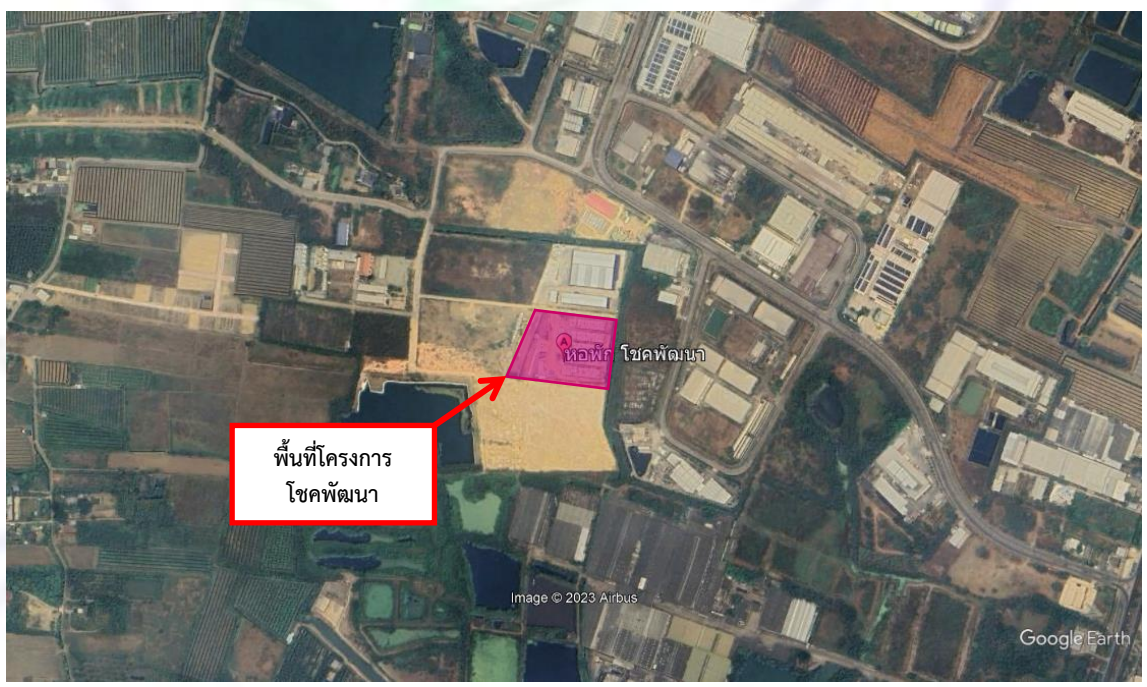
รูปที่ 1 แสดงตำแหน่งพื้นที่ตั้ง โครงการ โซคพัฒนา

ดำเนินการสำรวจสภาพเศรษฐกิจและสังคม โครงการ โซคพัฒนา พื้นที่โครงการ ตั้งอยู่ที่ ตำบลเจ็ดเสมียน อำเภอบัวชุม จังหวัดราชบุรี (รูปที่ 1) โดยมีรายละเอียดการสำรวจ ดังนี้