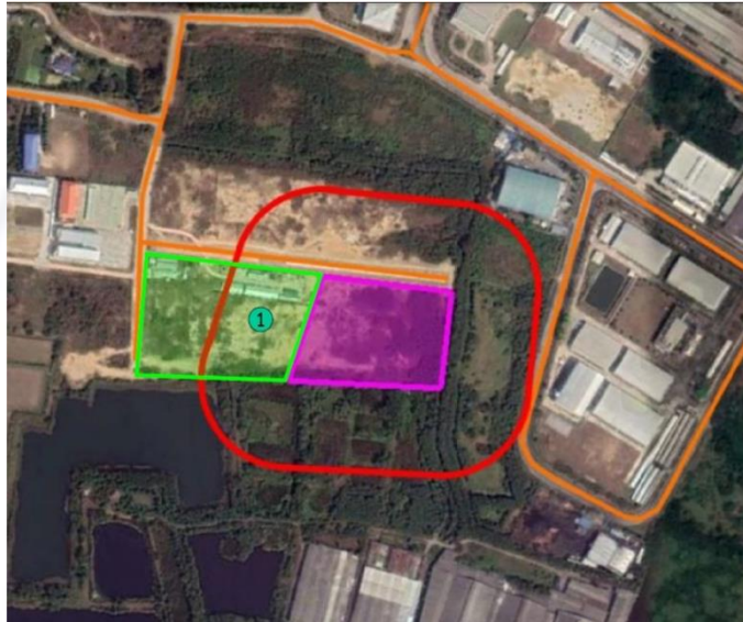
รูปที่ 2 ผังแสดงพื้นที่ติดโครงการ

ดำเนินการสำรวจสภาพเศรษฐกิจและสังคม บริเวณพื้นที่ติดโครงการ โซคพัฒนา จำนวน 1 ตัวอย่าง (รูปที่ 2)