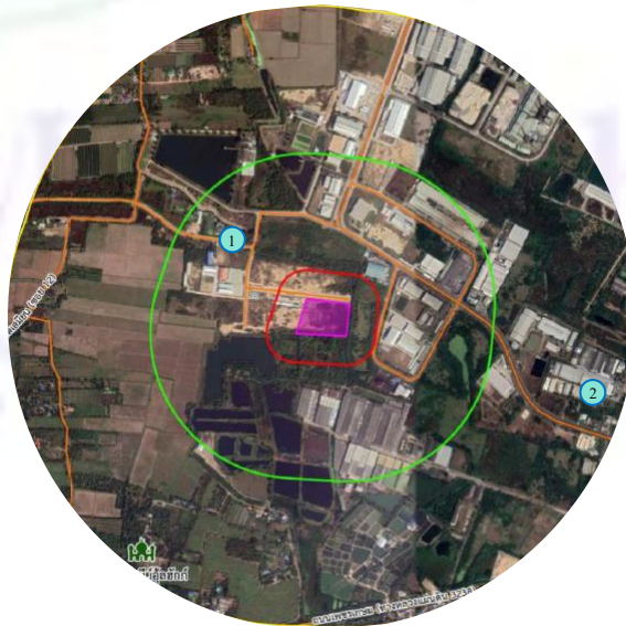
รูปที่ 5 ผังแสดงพื้นที่ชุมชนและหมู่บ้านในพื้นที่ศึกษา

ดำเนินการสำรวจสภาพเศรษฐกิจและสังคม บริเวณชุมชนและหมู่บ้านในพื้นที่ศึกษา โครงการ โศกพัฒนา จำนวน 2 ตัวอย่าง (รูปที่ 5)